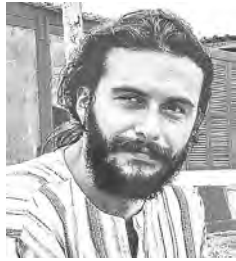
Escribe Gökem Duru Desde Túnez, 22 de enero de 2016

Túnez... El joven graduado desocupado... Se mató... Los que escuchan estas palabras enseguida recuerdan a Mohammad Bouazizi, el joven diplomado en paro que se prendió en fuego el 17 de diciembre de 2010 convirtiéndose en la mecha de la revolución tanto en su país como en toda la geografía árabe. Entonces las masas que salieron a la calle reivindicando trabajo, pan y libertad lograron derrumbar al dictador, Ben Ali, pero no pudieron acabar con todo el régimen dictatorial. La burguesía tunecina y el imperialismo, para poder controlar la movilización de las masas tunecinas que fue un “mal ejemplo” para los pueblos de la región, y para poder estabilizar mínimamente la situación política, intervinieron con toda su fuerza en el proceso revolucionario, y siguen haciéndolo. El objetivo de su intervención fue, sin tocar mucho las conquistas democráticas (libertad de expresión, de organización, etcétera) salvaguardar el régimen (de hecho una parte importante de la izquierda tunecina se acopló a este política pensando que ya era hora de volver a casa una vez que Ben Ali estaba destituido), seguir con las políticas neoliberales, hacer olvidar las reivindicación de trabajo y pan de las masas. Una vez que el proceso estaba canalizado en ese rumbo, “reconstituir la estabilidad” ha sido mucho más difícil de lo que se pensaba, ni tampoco ha sido posible parar la profundización de la crisis económica y social. La última prueba de esta realidad es la nueva mecha que encendió Ridha Yahyaoui.