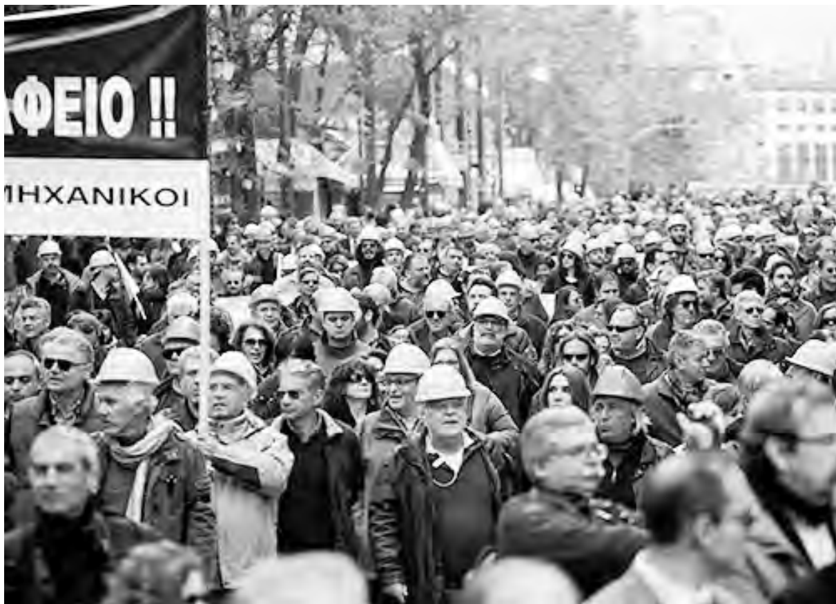
Movilización de los obreros de la construcción en Grecia

Mientras el gobierno de Syriza avanza en la aplicación del plan exigido por la Troika, van creciendo las protestas. Paros y manifestaciones son el escenario diario de Grecia, mientras se prepara un paro general para el 4 de febrero.