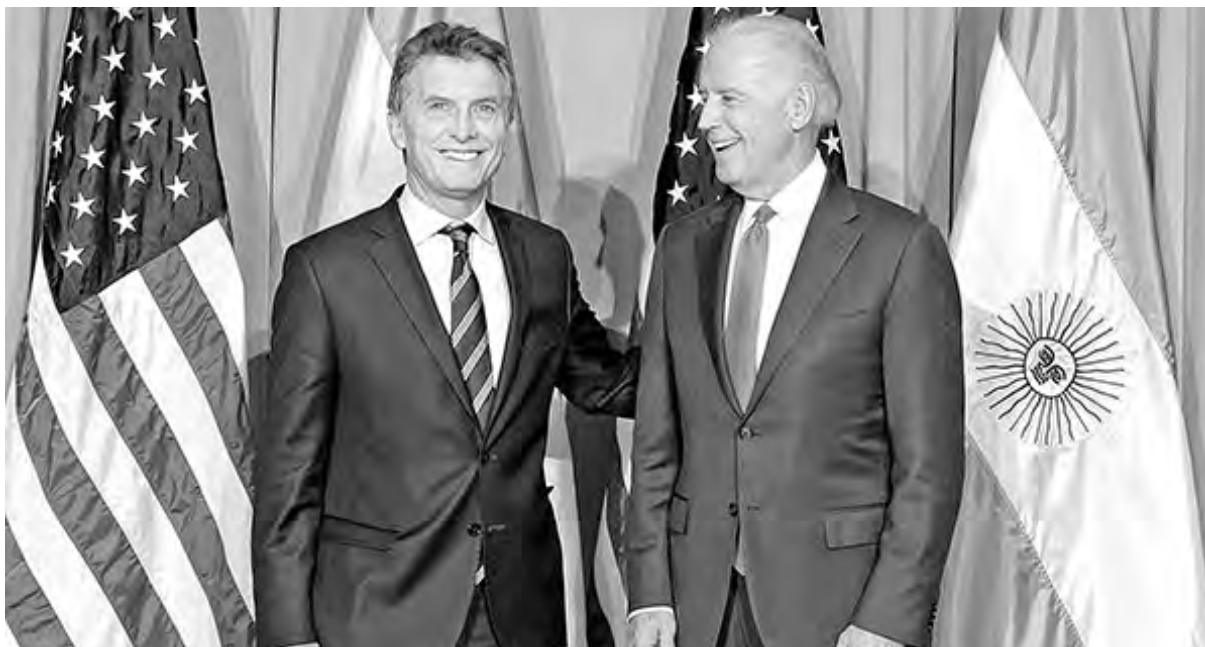
Macri con el vicepresidente de Estados Unidos

Después de 13 años de ausencia de nuestro país en la cumbre de Davos, Suiza, Argentina volvió de la mano de Mauricio Macri. En ese foro económico mundial el presidente se reunió con empresarios millonarios y los CEOs de las multinacionales más importantes del mundo -Coca Cola, Shell, Total y Microsoft-. Mantuvo encuentros con presidentes de las principales potencias imperialistas (Estados Unidos e Inglaterra) y alcanzó acuerdos comerciales bilaterales con Benjamín Netanyahu, el primer ministro del estado genocida de Israel, un auténtico criminal contra el pueblo palestino (ver recuadro).