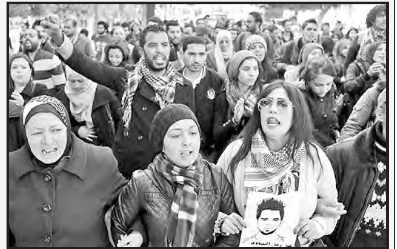
Vista de una de las masivas marchas

acabara con su política reformista de identificarse con la defensa de las conquistas democráticas, y que se reorienta según las exigencias que vienen desde las masas que piden un radical cambio social y económico. Esto, además, es una cuestión de ser o no ser para el Frente. De la misma manera la Unión General de los Trabajadores Tunecinos (UGTT) tiene que tomar parte en la lucha poniendo en marcha un plan de acción urgente -que tiene que incluir una posible huelga general- para la creación de puestos de trabajo y la subida de los salarios, con el fin de fortalecer las luchas. Es de importancia vital la presión de las bases de UGTT sobre su dirección burocrática para movilizar al sindicato.